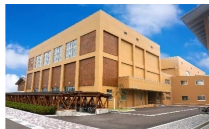
能代松陽高等学校体育館

一種電気工事・一級電気施工管理技士など自分自身のスキルをアップさせるためにも資格・免許取得について各種助成を行っております。