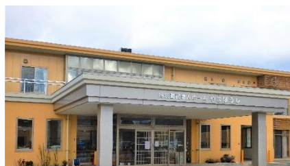
特別養護老人ホームやまぼうし